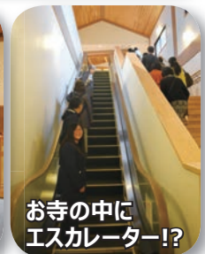
お寺の中にエスカレーター!?