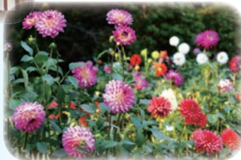
神代植物公園 秋のダリア園

散策しながら俳句を詠んでみる、 など企画中! 秋の植物園も楽しそうです。 ご一緒にいかがでしょうか？