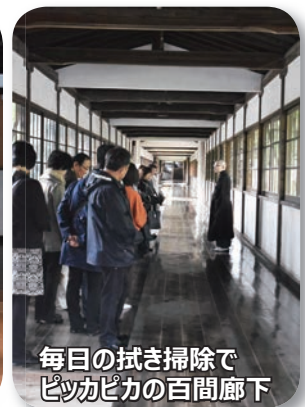
毎日の拭き掃除でピッカピカの百間廊下