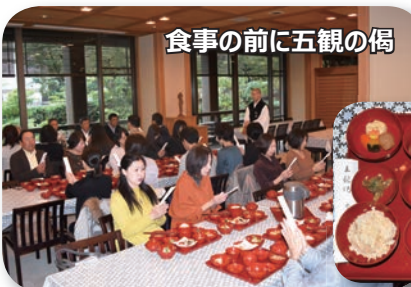
食事の前に五観の偈