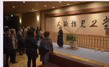
前回の總持寺日帰り参禅会 平成29年10月